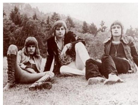
Emmerson, Lake & Palmer

Er også et engelsk rockband, opstod i 1967 af Ian Anderson. Gruppens musik udviklede sig igennem tiden, men de bedste år med progressive rock produktionen var sidst i 70'erne.