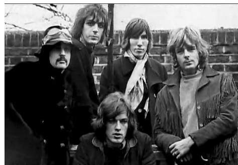
Pink Floyd (1968)

Pink Floyd, et engelsk rockband, der udviklede sig igennem 60'erne. Blev skabt af Syd Barret, Roger Waters, Nick Mason og Rick Wright. Deres progressive stil blev frembragt efter deres udskiftning af Syd Barret med David Gilmour. Bandet stoppede med at indspille albums i 90'erne.