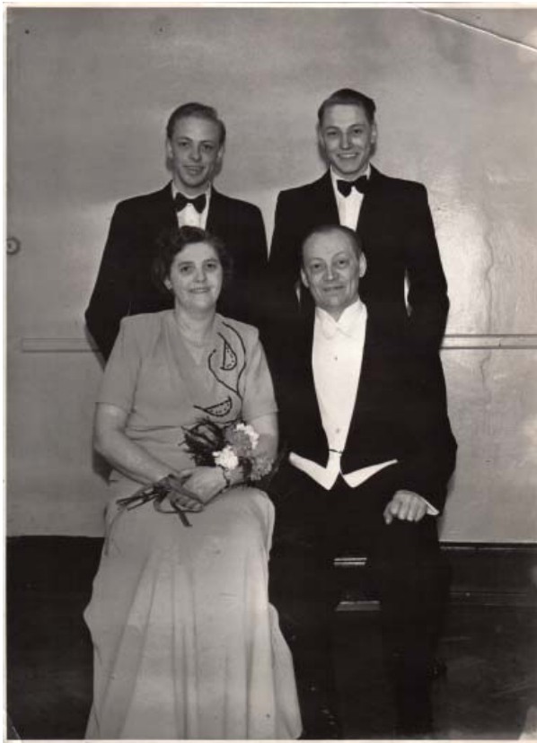
Familie-portræt 26-4-50 - sølvbryllup

Det næste var vist så, at de fandt på at købe kaffebær på Tingstedet i Valby. Det var i 1948, vistnok den 1. maj. De fik den hurtigt drevet op til en virkelig fin forretning med en masse stamkunder, som både hentede madpakker, inden de om morgenen gik på arbejde, men som også kom og spiste middagsmad efter dagens møje og besvær. Også der var de myreflittige og begyndte kl 4 om morgenen, med at forberede dagens gøremål, smøre smørrebrød og koge kaffe.