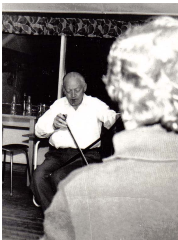
Farfar underholder på Imatra

Efterhånden som årene gik, kom økonomien i stadig bedre stand, og efter de første hårde og stramme vintre var det ikke længere nødvendigt at tjene supplerende indtægter i de mørke måneder. Mor og far havde altid været begejstrede for at komme på rejser og se fremmede steder og fremmede mennesker, så nu begyndte de at interessere sig for dette felt. De forsøgte sig både