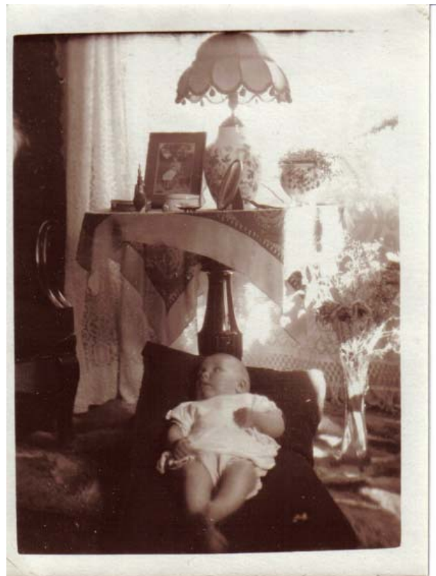
Barn og interiør