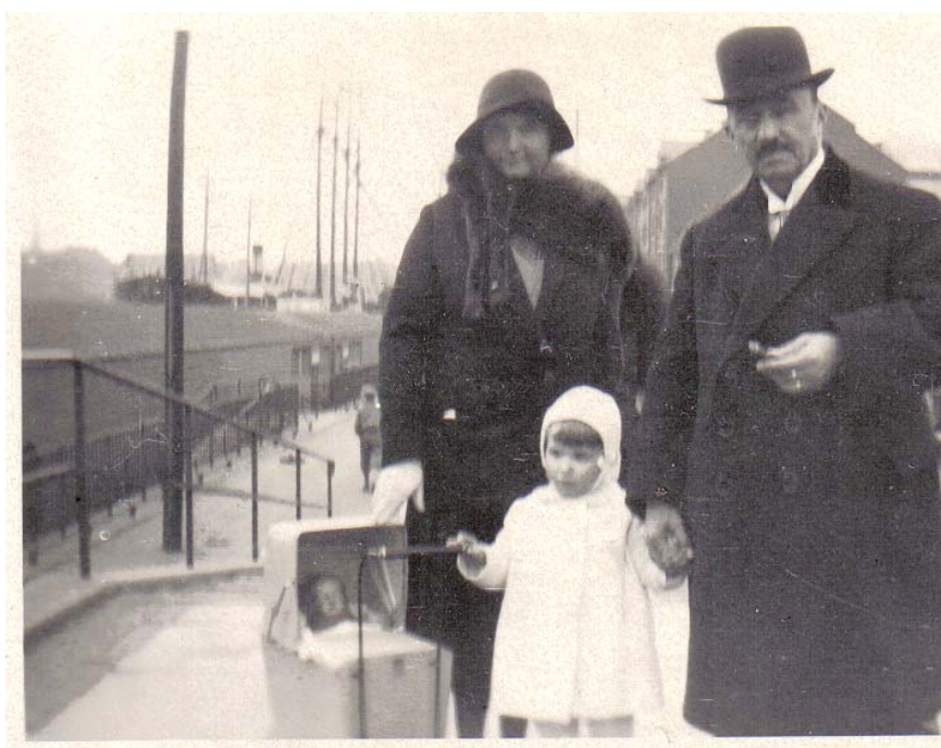
Far, mor, barn og dukke i starten af 30'erne